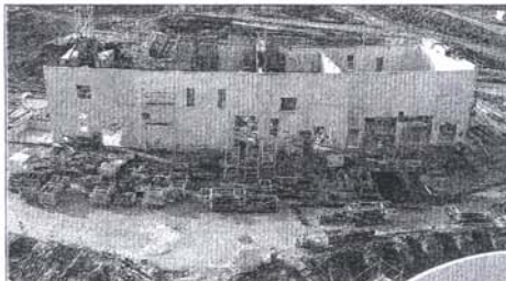
▲ Le bâtiment technique est également bien avancé puisque les fondations sont terminées depuis plusieurs mois et que les murs ont déjà été montés.