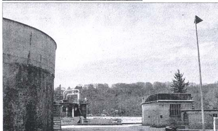
Voici l'actuelle station d'épuration de Coulommiers, encore en activité. Quelques travaux de raccordement des réseaux seront à effectuer avant de mettre en fonction la nouvelle station.