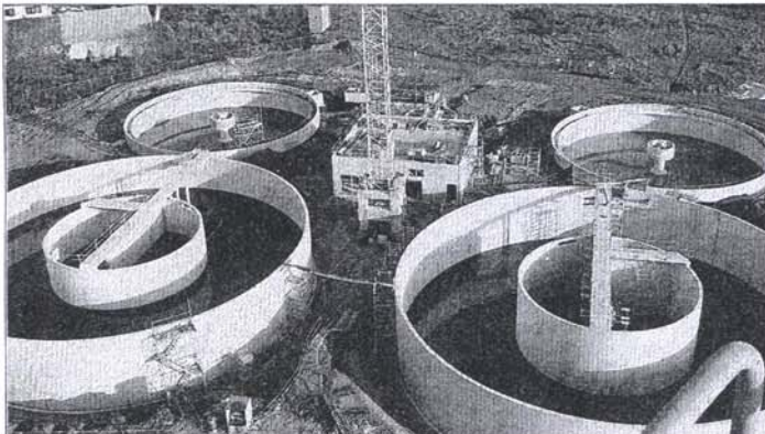
▲ Voici les quatre bassins vus du ciel. Les premières mises en eau sont programmées en juillet prochain pour effectuer des tests avant la mise en fonctionnement définitive prévue pour le mois d'octobre 2010.

D'ici la fin d'année, Coulommiers et Mouroux seront dotés d'une toute nouvelle station d'épuration. Le Pays Briard a pu visiter ce chantier titanesque de près de 16 millions d'euros.