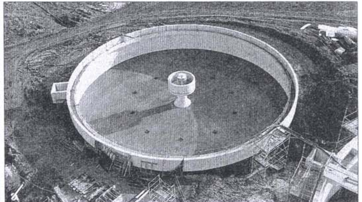
▲ Le chantier, qui a commencé au mois de juin 2009, a actuellement près de 2 mois d'avance sur les délais prévus. Du moins, avant la période de gel qui vient d'être entamée. Depuis plus d'une semaine, les travaux sont stoppés par le froid.