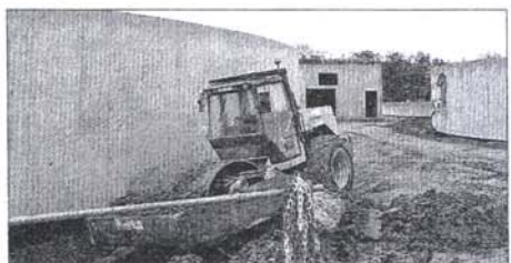
◀ Vus du sol, les différents bassins d'aération et de décantation sont d'une taille impressionnante. La nouvelle station d'épuration sera largement dimensionnée pour traiter les eaux des communes de Coulommiers et de Mouroux. Lorsqu'elle ouvrira ses portes, elle ne devrait fonctionner qu'à 60% de ses possibilités.